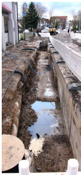
12.03: Baugraben in der Vaihinger Straße

Die Bahnhofstraßenkreuzung ist seit 09.03.2018 wieder offen und die Baustelle bewegt sich weiter im Bauabschnitt 2 in Richtung Glems. Hier will man dann Ende Mai fertig sein und bereits Mitte Mai an der Einfahrt der Ludwigsburger Straße weiterarbeiten. Das Ende des Bauabschnitts 1 wird mit der Fertigstellung des Vaux-le-Pénil-Platzes bis Ende April erwartet.