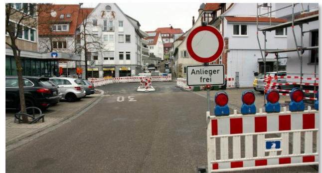
09.03: Die Bahnhofstraßenkreuzung ist für Anlieger offen