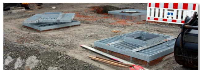
13.03: Baumquartiere am Vaux-le-Pénil-Platz