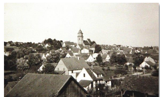
Blick auf das alte Schwieberdingen um 1935

Exklusiv für unsere ABG Info Leser gibt es ein erstes Bild als kleiner Einblick in die historischen Welten Schwieberdingens. Wir hoffen damit Ihre Vorfreude auf den Kalender zu steigern. Wer sich generell an Bildern von Schwieberdingen erfreut, kann auch gerne einen Blick in die bisherigen Adventskalender werfen. Diese sind weiterhin auf unserer Internetseite verfügbar.