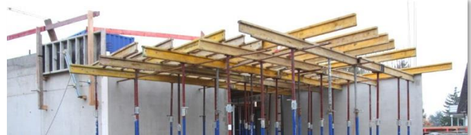
Oben: 19.06.2017: Als der Bagger noch am Werk war Mitte: 17.11.2017: Rohbau in vollen Zügen (Eingangsportal) Unten: 23.11.2018: Das fertige Gebäude mit Parkplätzen

Die Historie zur Planung und Entstehung der KiTa Pustebblume und umfangreiche Bildergalerien zu deren Bauphase finden Sie auf ABG Internetseite unter www.abg-schwieberdingen.de .