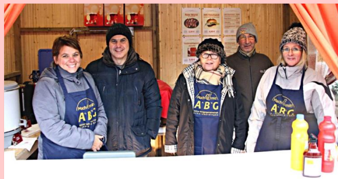
Unser eingespieltes Team bedient Sie auch 2018 wieder gerne

Der ABG-Stand ist ab 12 Uhr besetzt und verköstigt Sie bis zum Ende des Marktes um 19 Uhr. Wir freuen uns auf Ihren Besuch!