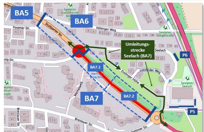
Übersichtspläne: Oben: Bauabschnitt BA6.1, Mitte: Bauabschnitt BA6.2, Unten: Bauabschnitt BA7.1 & BA7.2