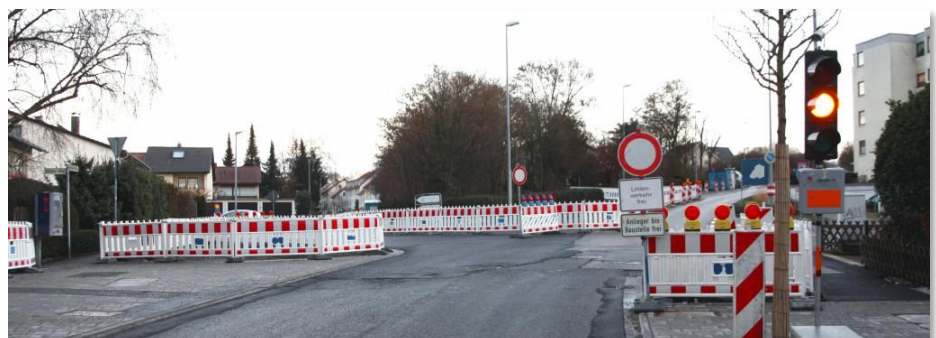
14.01.2019: Ein aktueller Blick auf die Baustelle mit neuer Baustellenampel