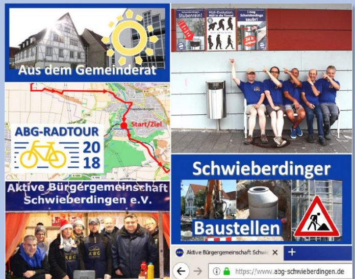
Nur ein kleiner Überblick unserer Aktivitäten in 2018